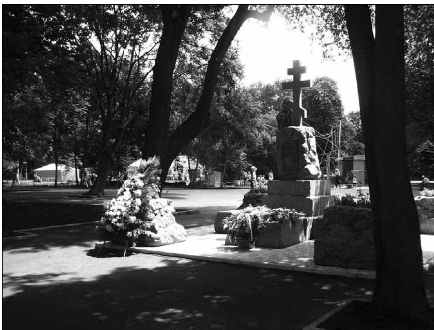
Так теперь в Одессе отмечено место захоронения генерала от инфантерии Ф. Ф. Радецкого, героя-«воина за Веру, Царя и Болгарскую свободу»