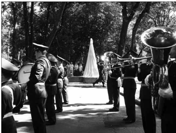
Торжественное открытие памятного знака генералу от инфантерии Ф. Ф. Радецкому. 15 июня 2011 г.