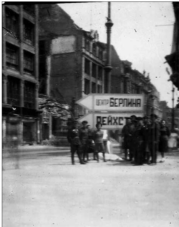
Медперсонал госпиталя в Берлине. 1945 г.