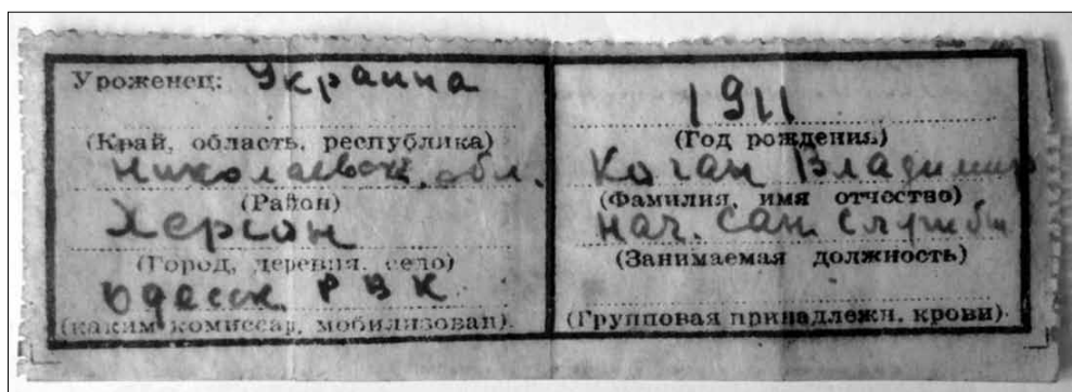
Вкладыш военного медальона. 1930-е гг.

В сентябре 1944 г. приказом по войскам 13-й армии 1-го Украинского фронта от имени