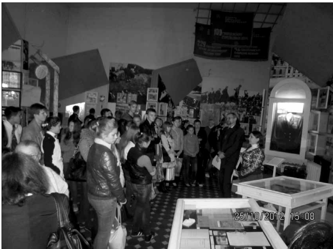
Открытие выставки «Спасает жизнь, даря надежду...». 2012 г.

мейского полевого госпиталя для легкораненых № 2667 подполковник медслужбы В. Б. Коган был награжден орденом Отечественной войны 1-й степени. В наградном листе отмечено, что: «за период его руководства работой ГЛР № 2667 из последнего возвращено в строй более 21641 бойцов и офицеров... В период январско-февральских и завершающих апрельских операций 1945 года, обеспечивая быстрое продвижение госпиталя вслед за войсками, сумел обеспечить одновременно обслуживание... значительных контингентов легкораненых, превышавшее в 2–2,5 раза штатное количество мест» [24].