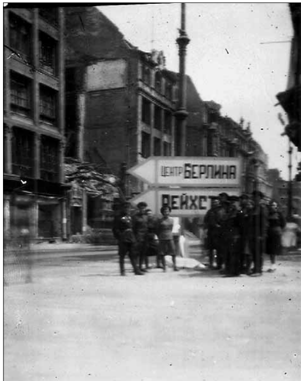
Медперсонал госпиталя в Берлине. 1945 г.