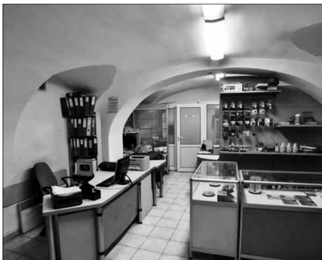
Здание на ул. Пушкинской, 44 (полуподвал). 2014 г.

Для Попечительного комитета в 1854 г. его председатель – барон Местмахер – предписал разыскать в колониях портрет первого попе-