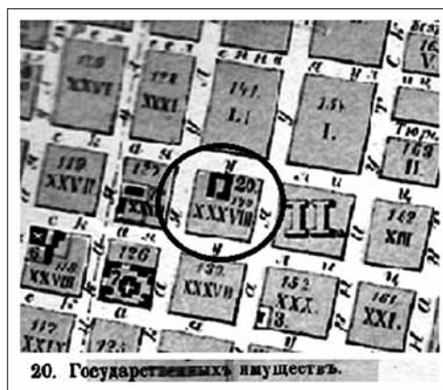
Фрагмент плана (1894)