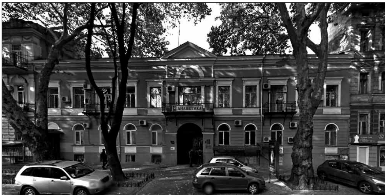
Здание на ул. Пушкинской, 44. 2014 г.

государственных имуществ Попечительному комитету об иностранных поселенцах Южного края России собственный свой двор и строения», в числе которых значились: «плановый вновь отстроенный в черте каменный двухэтажный дом, отдельный двухэтажный каменный флигель, цистерна, галерея в земле под каменным сводом». Кроме этого, на участке оставались заготовленные строительные материалы и «до ста чугунных квадратных в один аршин плит» [3, л. 2–2 об.]. Все это было приобретено в казну за 20 тыс. руб. серебром, часть которых выручили от продажи бывшего конторского дома. По какой причине владелица избавилась от своей собственности, неизвестно. Изначальной постройкой дома как частного можно объяснить наличие на фасаде административного здания балконов, не свойственных казенным заведениям.