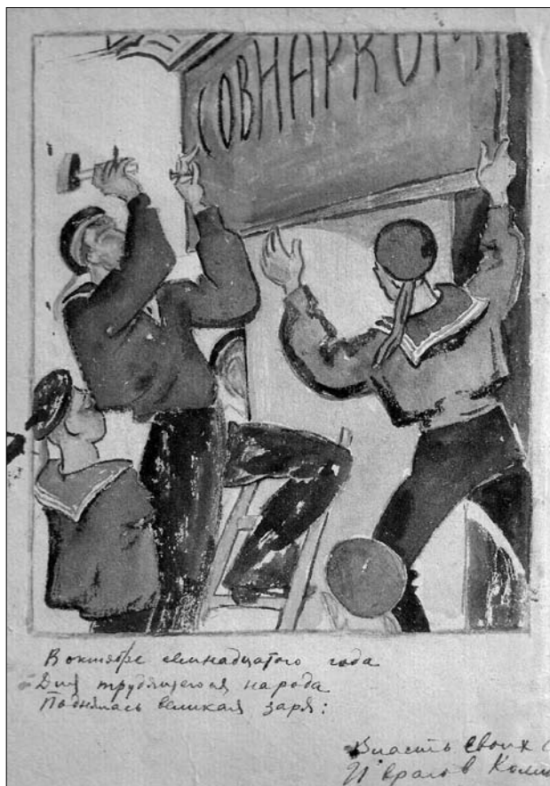
Э. Багрицкий. 1920 г.

4. Техника размножения. Первоначально для каждой витрины делалось особое «Окно». Поэтому первые «Окна» выходили каждое в одном