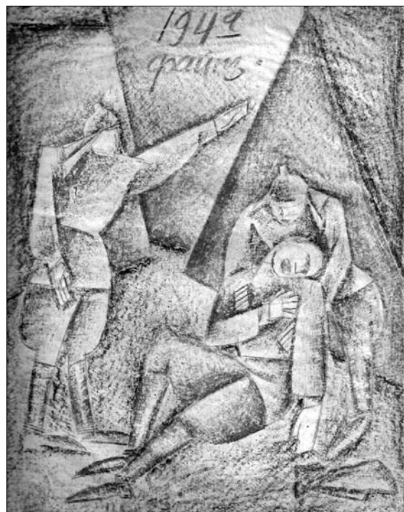
М. Файнзилберг. 1920 г.